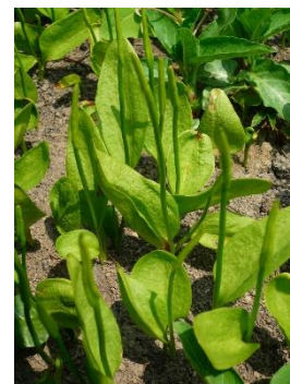
トネハナヤスリの群生

※観察会は原則、野外実施ですが、当日途中で雨が降ってきた場合などは活動センター室内を利用することがあります。