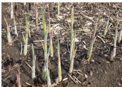
ヨシ焼き後のヨシの芽吹き