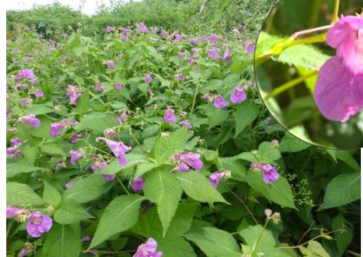
ワタラセツリフネソウ

※雨天の場合、「体験活動センターわたらせ」で、見頃の植物の紹介や植物サンプルの観察、パネルの紹介など行います。