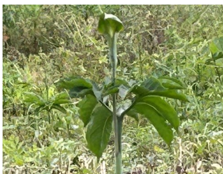
マイヅルテンナンショウ