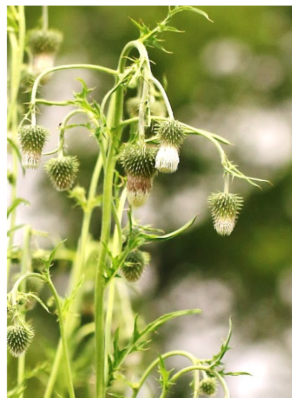
シロバナタカアザミ

※雨天の場合、「体験活動センターわたらせ」で、見頃の植物の紹介や植物サンプルの観察、パネルの紹介など行います。