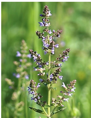
ミゾコウジュ (準絶滅危惧種)