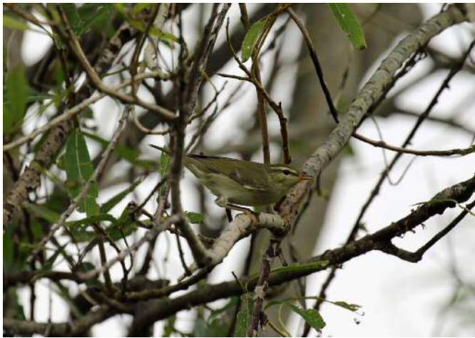
センダイムシクイ