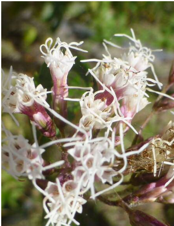
フジバカマ(準絶滅危惧)