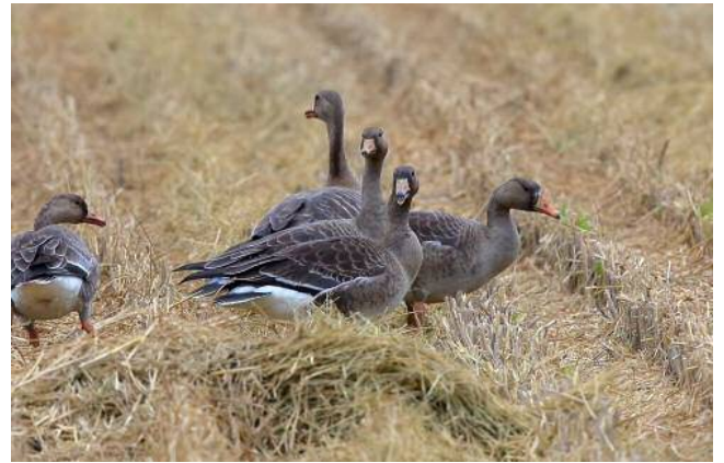
マガン (準絶滅危惧)