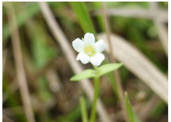
ヒメナエ(絶滅危惧)