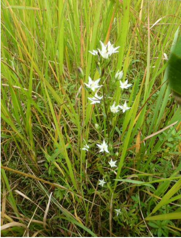
イヌセンブリ(絶滅危惧)

10月後半に入り、野鳥が飛来する季節となりました。双眼鏡を持ってお出かけください。 11月4日(金)植物観察会の参加募集をしています。