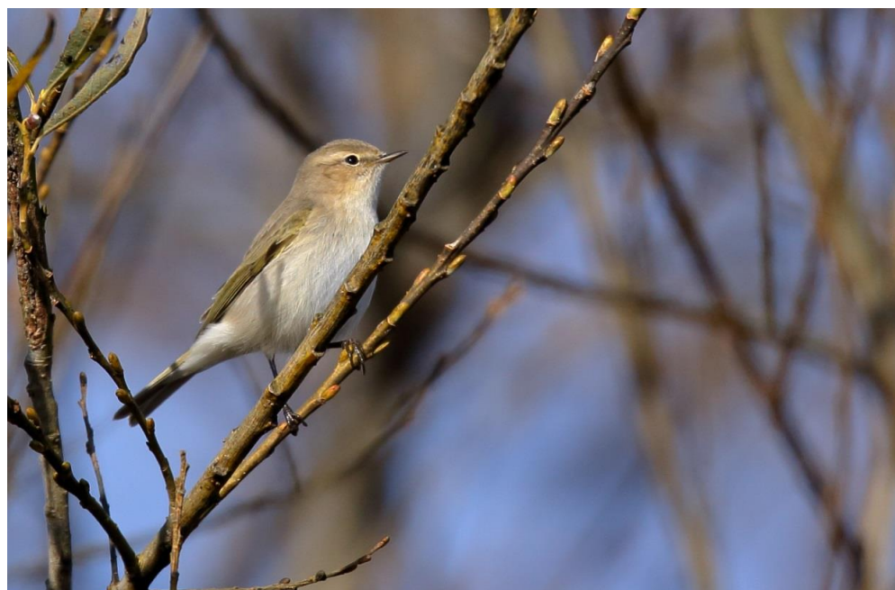
チフチャフ(ムシクイ科)

本年、最初の渡良瀬遊水地の近況です。今年もよろしくお願いたします。 遊水地内も乾燥しています、火の取り扱いに十分注意し、マナーを守って利用しましょう。