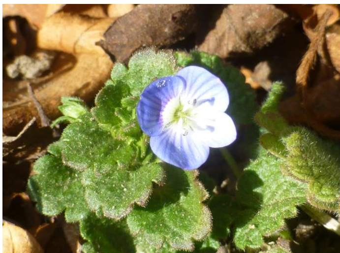
オオイヌノフグリ