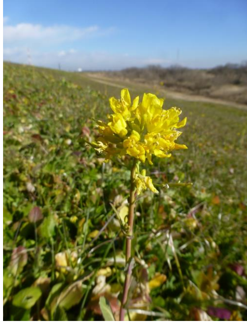
セイヨウアブラナ