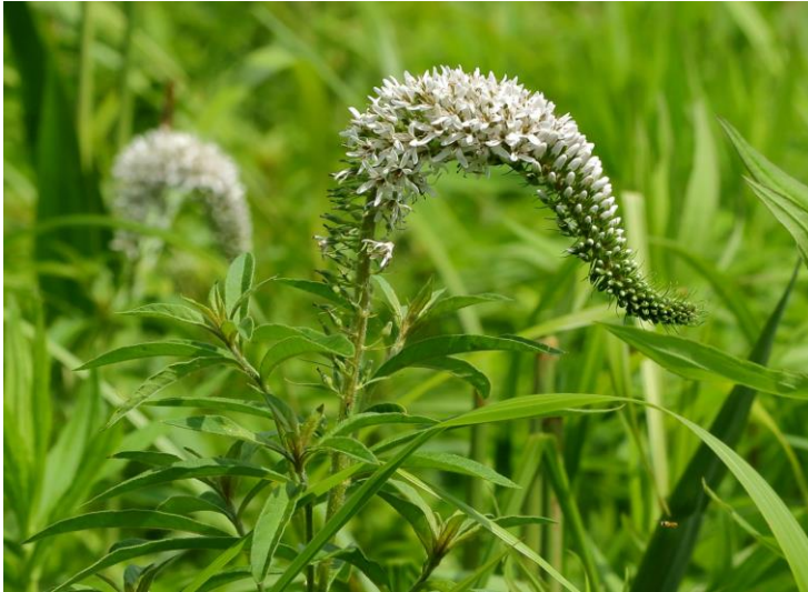
ノジロノオ(絶滅危惧)(ミニミニ植物園)