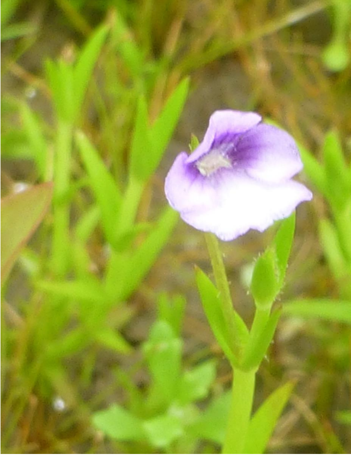
マルバノサワトウガラシ(絶滅危惧種) (湿地園)