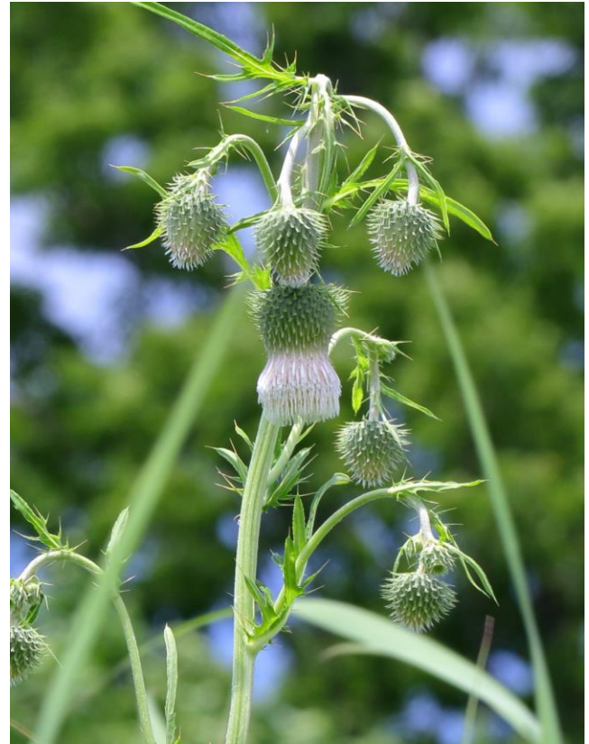
シロバナタカアザミ