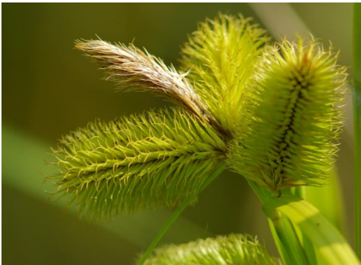
ジョウロウスゲ(絶滅危惧種)