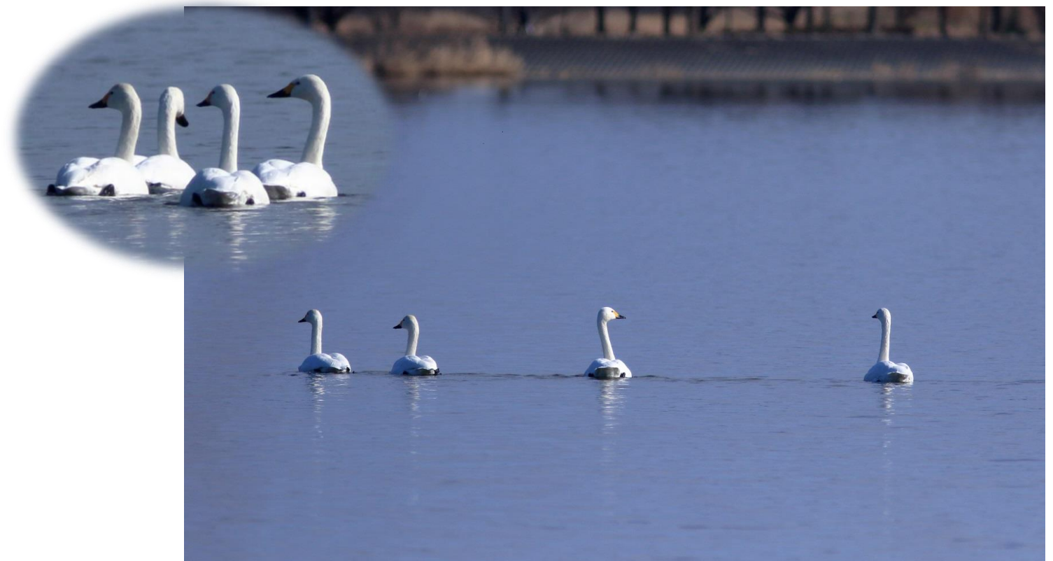
12月15日、谷中湖北ブロックにハクチョウ4羽、飛来