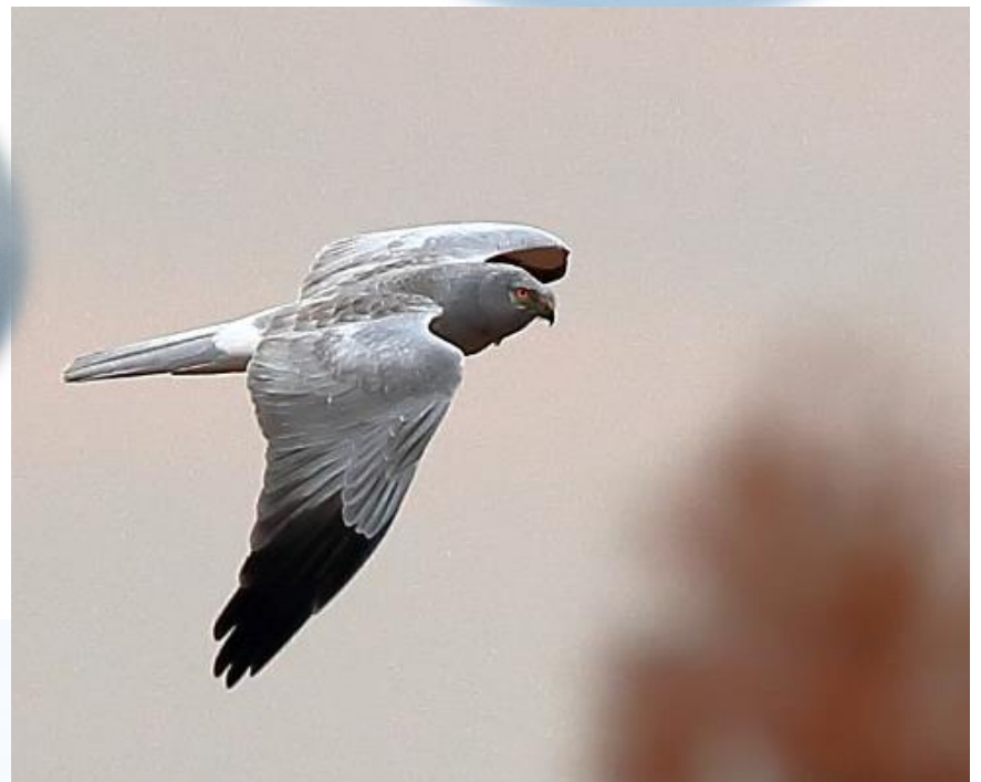
ハイロチュウヒ・オス