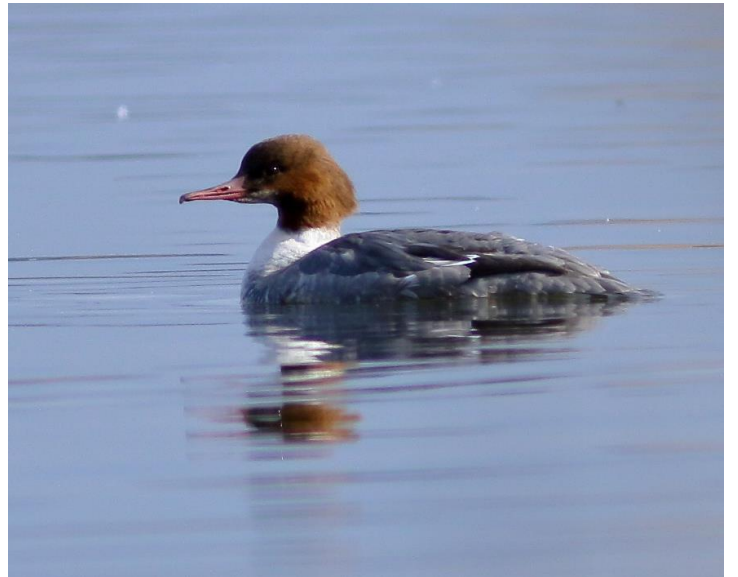
カワアイサ・メス