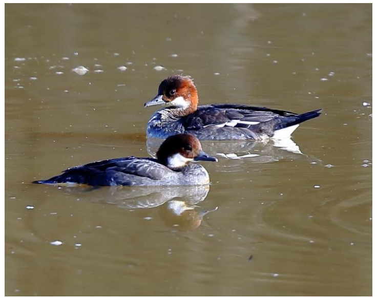
ミコアイサ・メス