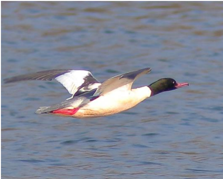
カワアイサ・オス