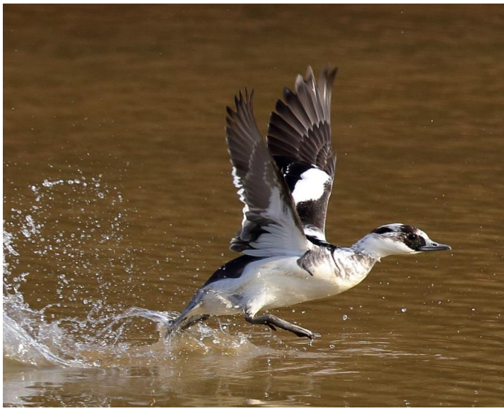
ミコアイサ・オス