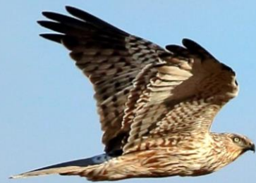
チュウヒ（絶滅危惧ⅠB類）