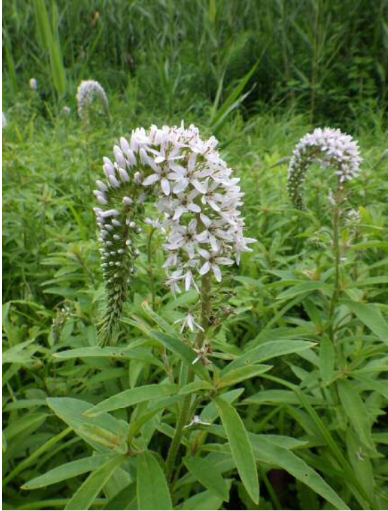
ノジトラノオ(絶滅危惧)

梅雨の晴れ間に、遊水地を散策してみませんか？ 急な雨などの、川の増水には気を付けましょう。