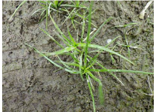
ミスニラ(準絶滅危惧)