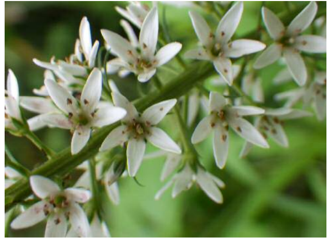
ノジヌマトラノオ