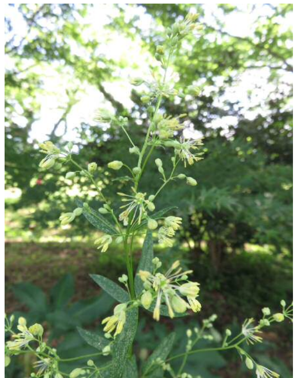
/カラマツ(絶滅危惧)湿地園