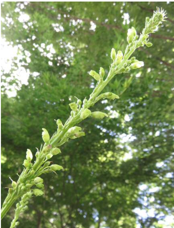
ゴマ/ハグサ(絶滅危惧)湿地園