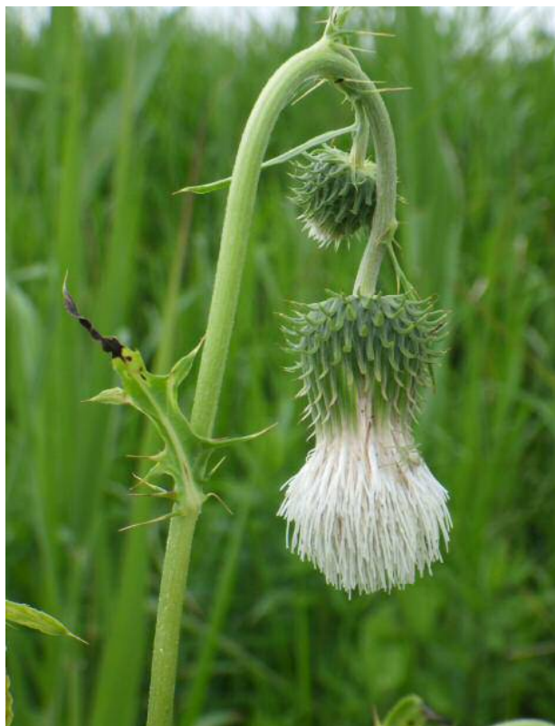
シロバタタカアザミ