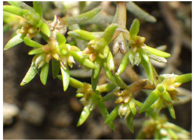
アスマツメクサ(絶滅危惧)