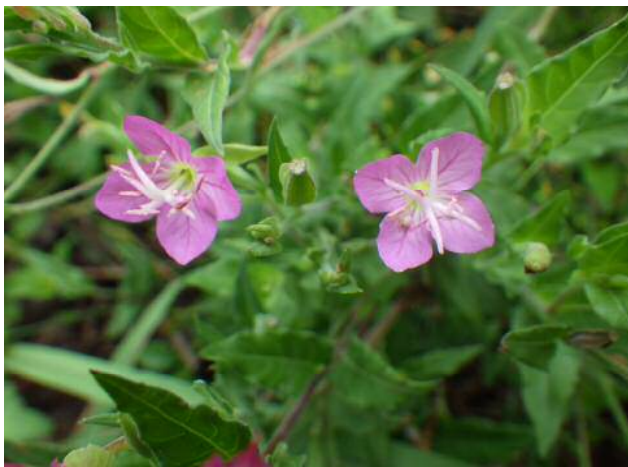
アカバナユウゲショウ