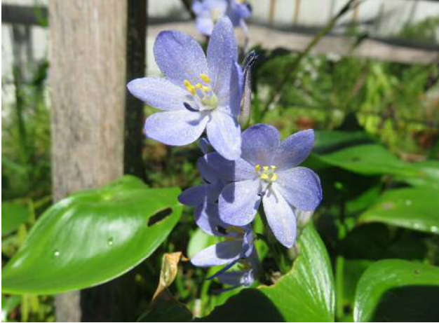
ミスアオイ(準絶滅危惧)湿地園

まだまだ、暑い日があります。散策等には水分補給を忘れずに！ 台風が多いので、急な雨などの、川の増水には気を付けましょう。