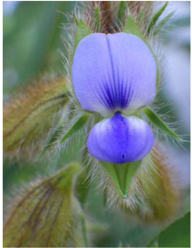
タヌキマメ(湿地園)