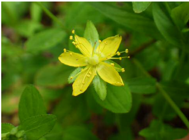
アゼオトギリ(絶滅危惧)