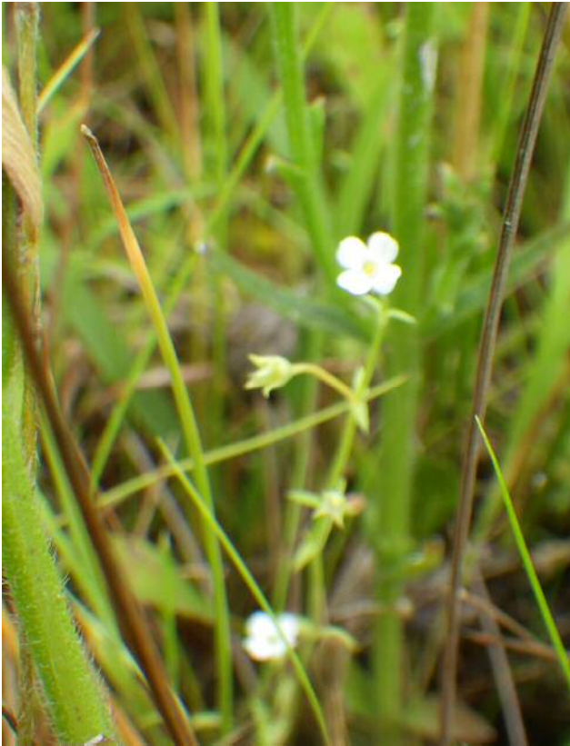
ヒメナエ(絶滅危惧)湿地園