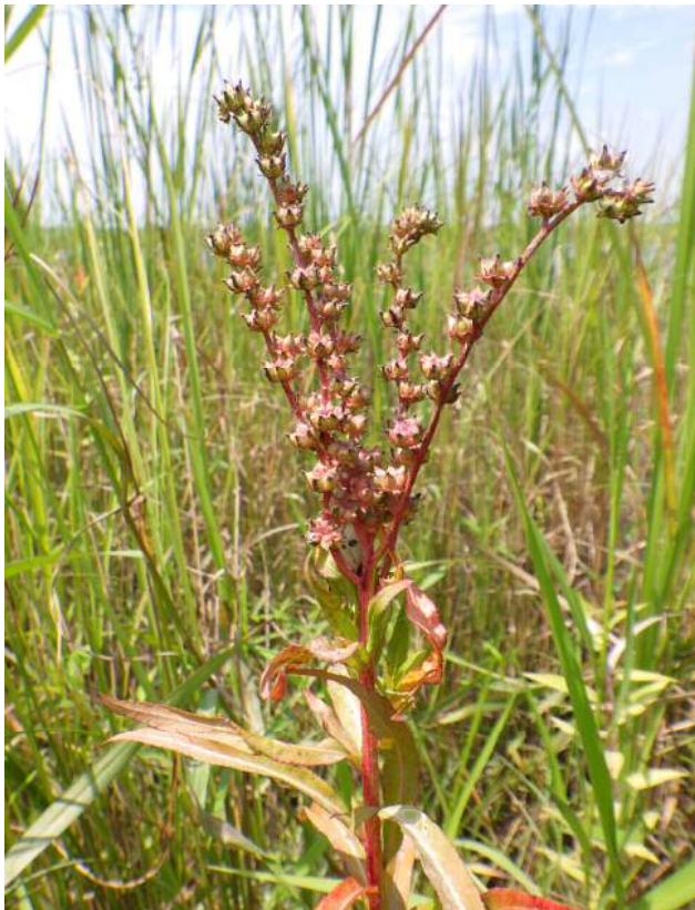
タコノアシ(準絶滅危惧)