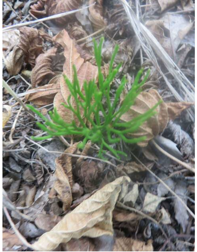
マツバラン(準絶滅危惧)