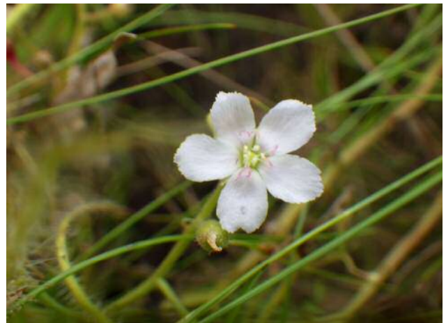
ナガバノイシモ千ソウ(絶滅危惧)湿地園