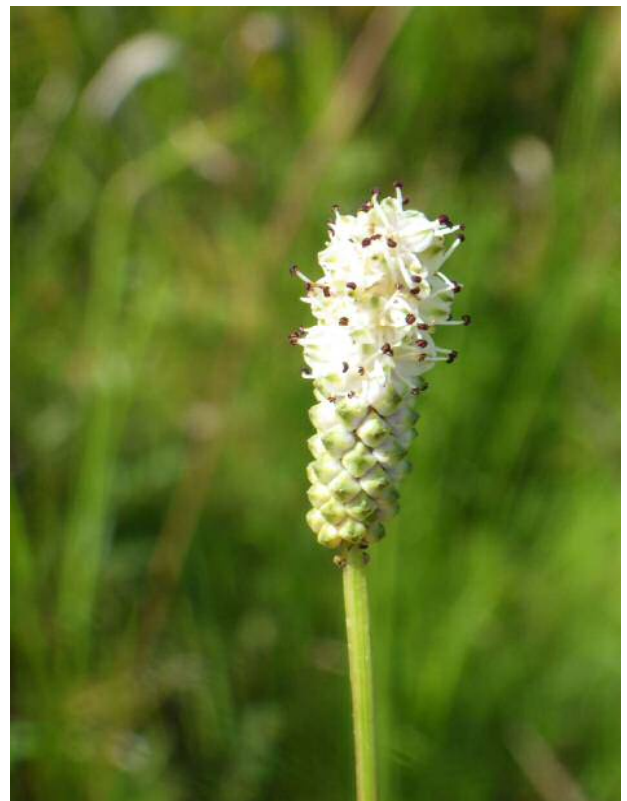
ナガボ/シロツレモコウ