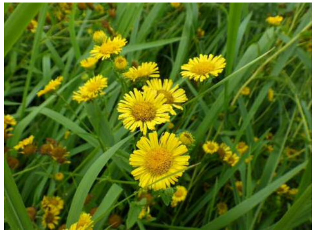
ホソバオグルマ(絶滅危惧)