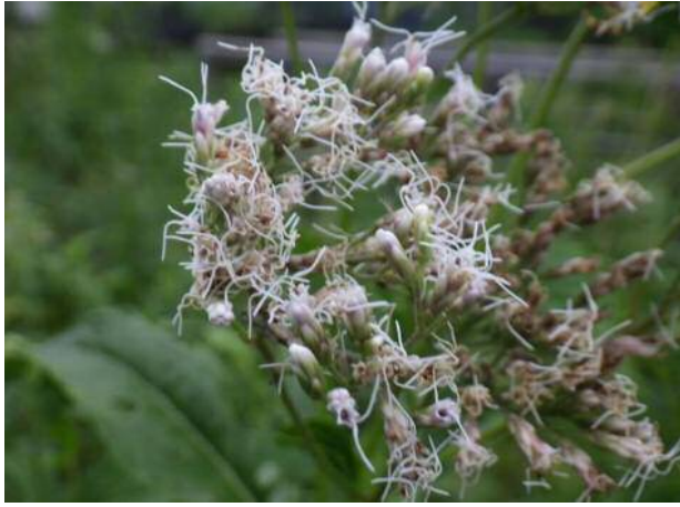
フジバカマ(準絶滅危惧)