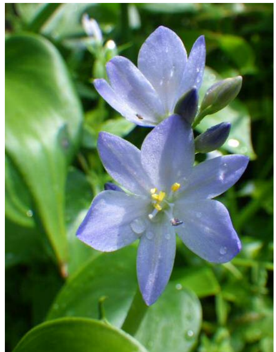
ミスアオイ(準絶滅危惧)湿地園