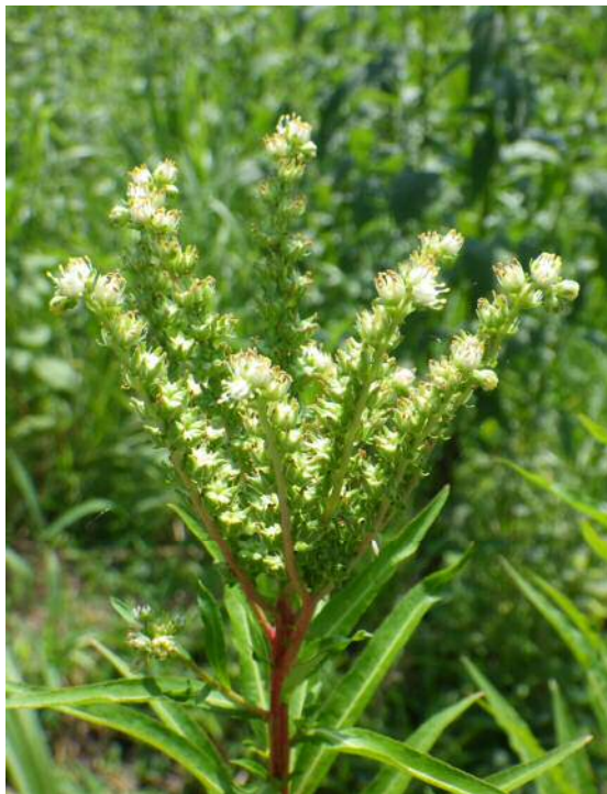
タコノアシ(準絶滅危惧)