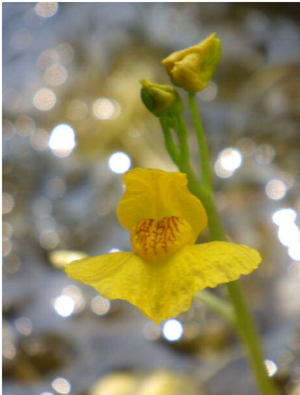
イヌタヌキモ(準絶滅危惧)