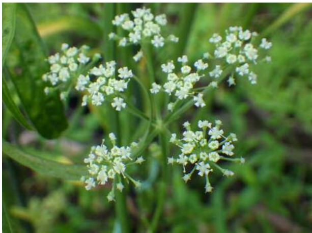
シムラニンジン(絶滅危惧)湿地園