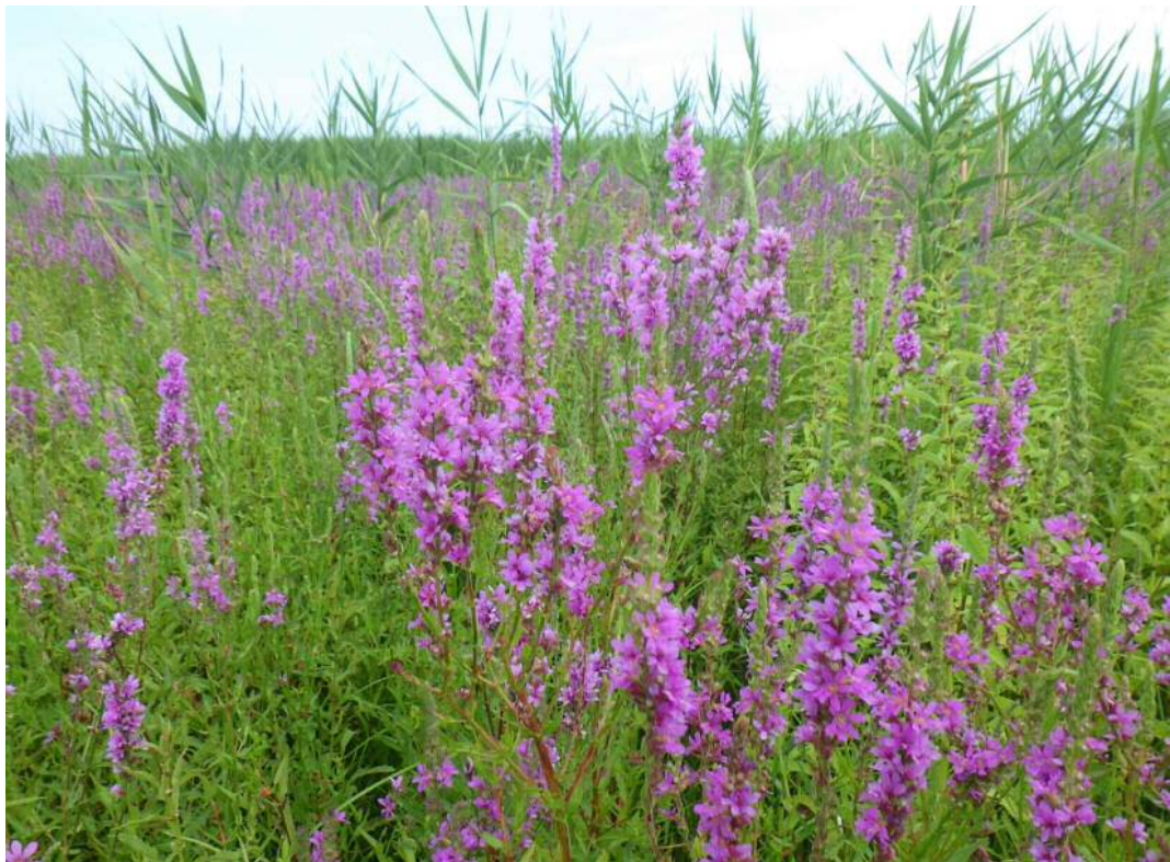
エゾミソハギの群落