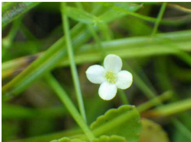
ヒメナエ(絶滅危惧)