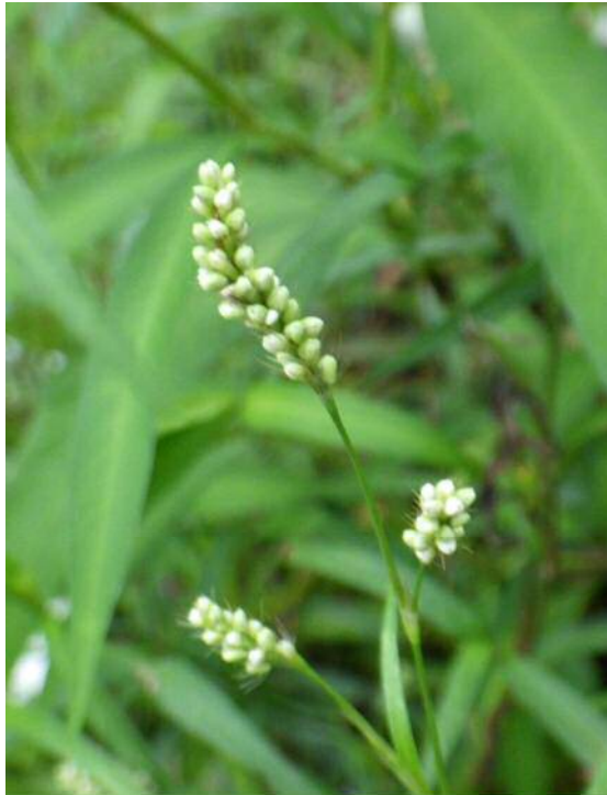
ヒメタテ(絶滅危惧)

台風など急な雨の、川の増水には気を付けましょう。 9月の植物観察会は、11日(水)、13日(金)です。参加お待ちしております。