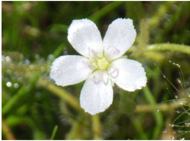
ナガバノイシモチソウ(絶滅危惧)