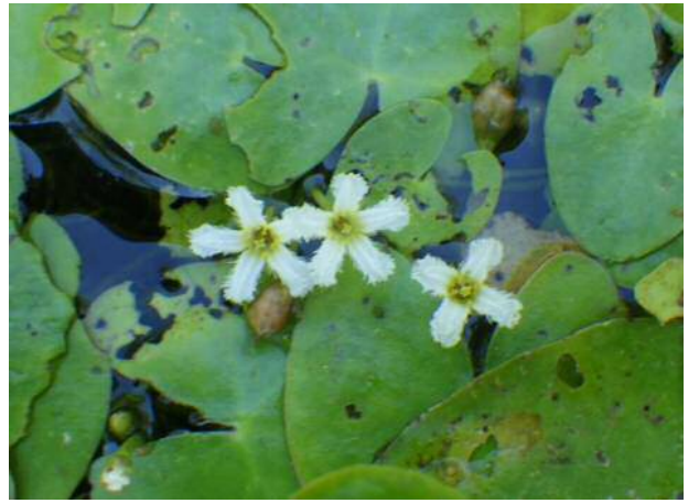
ヒメシロアサザ(絶滅危惧)