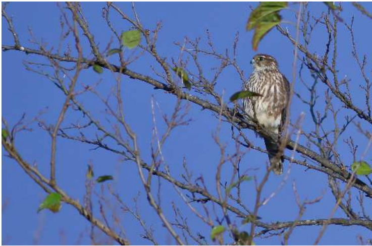
コチョウゲンボウ