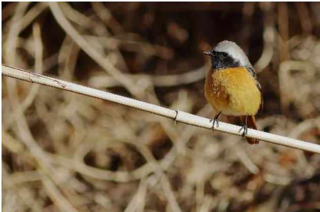
ジョウビタキ・オス