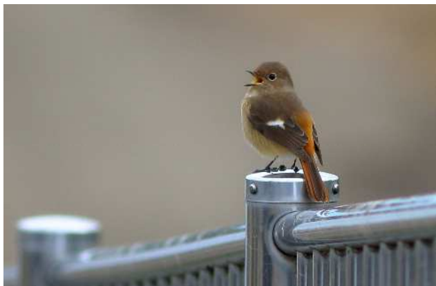
ジョウビタキ・メス