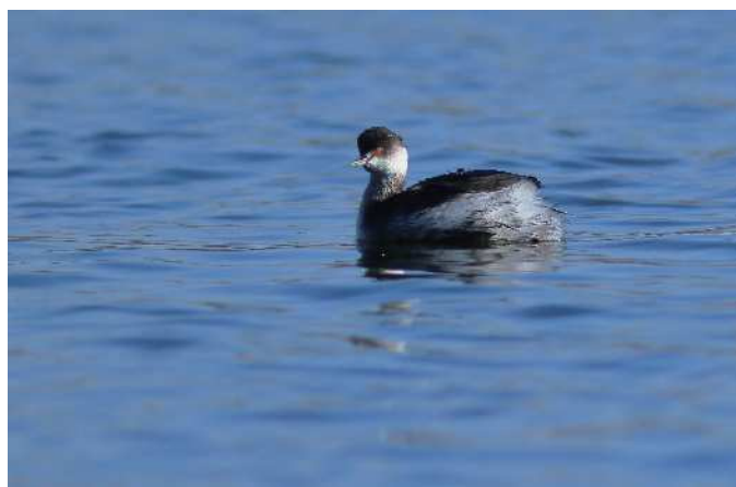
ハジロカイツブリ