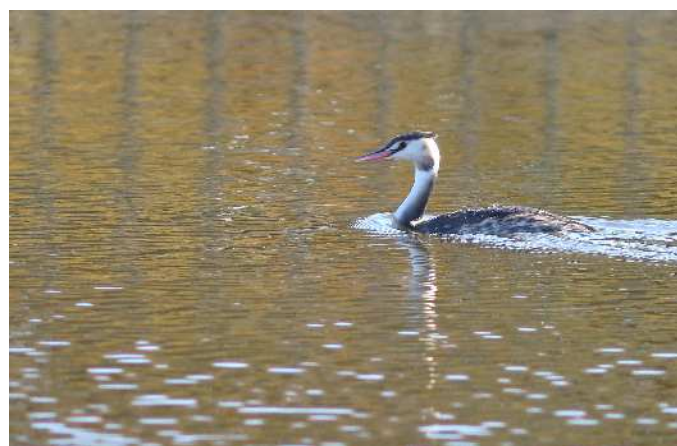
カンムリカイツブリ