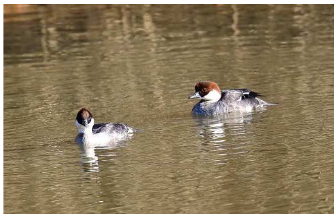
ミコアイサ・メス

渡良瀬遊水地は、鳥たちの季節になってきました。 双眼鏡片手に、豊かな自然を五感で楽しみましょう。