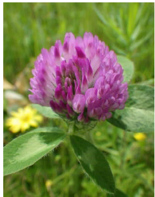
ムラサキツメクサ