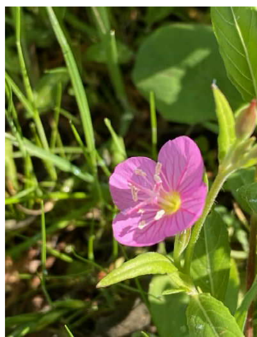
アカバナユウゲショウ