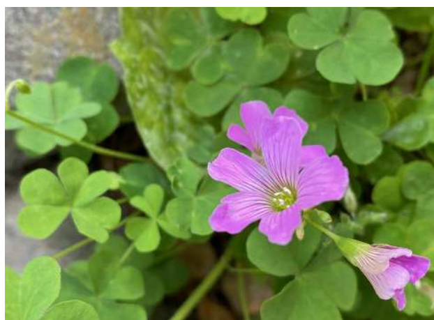
ムラサキカタバミ