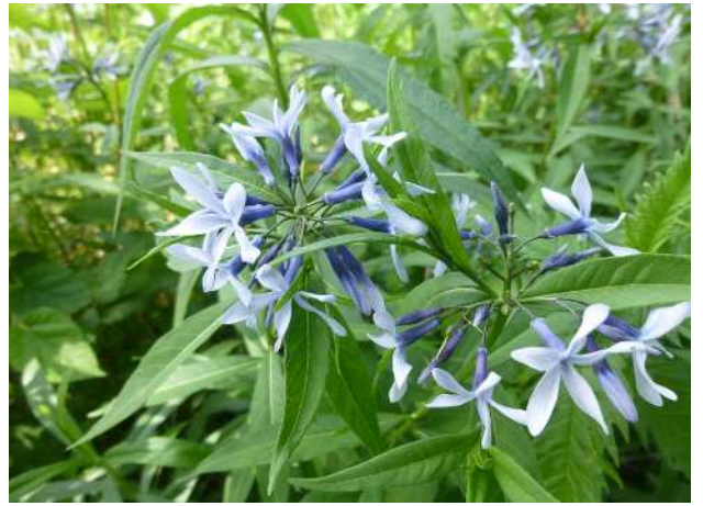
チョウジソウ(準絶滅危惧)