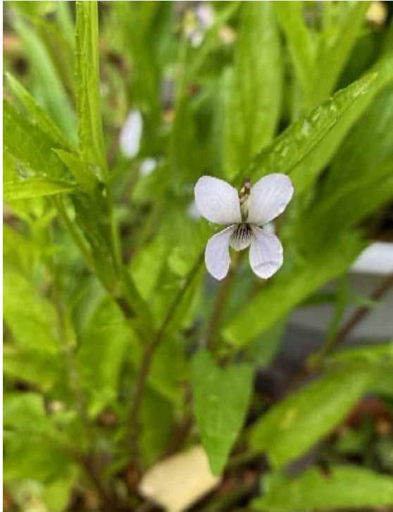
タチスミレ(絶滅危惧)湿地園

5月の遊水地は、響き渡る野鳥の鳴き声が心地よい季節になりました。 6月の植物観察会は10日(木)、15日(火)、野鳥観察会は6月26日(土)です。