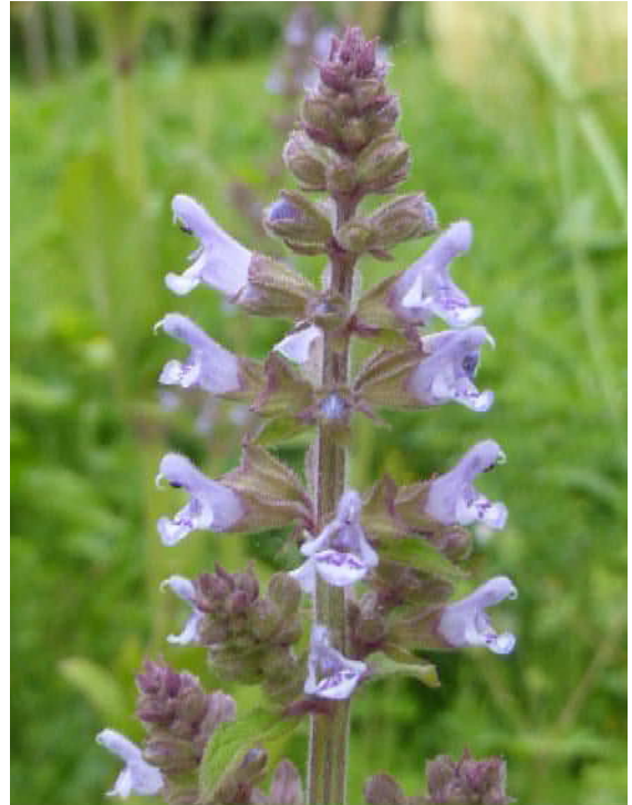
ミソコウジュ(準絶滅危惧)