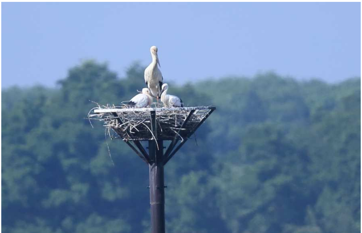
コウトリの親子(第2調節池内)