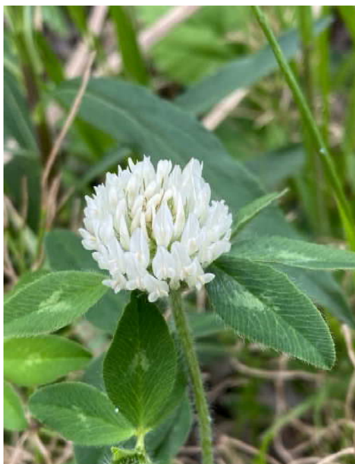
ムラサキツメクサシロバタ