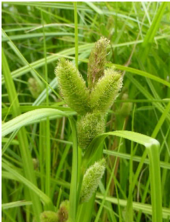
ジョウロウスゲ(絶滅危惧)湿地園