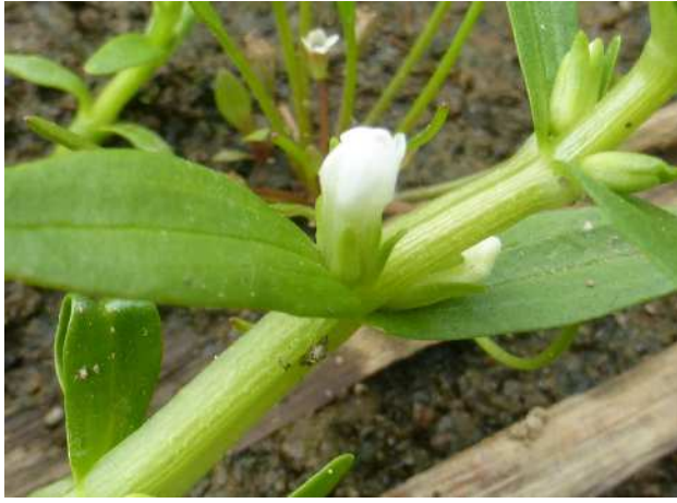
オオアブノメ(絶滅危惧)