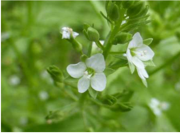
カワキシャ(準絶滅危惧)