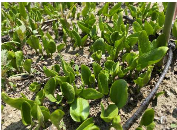
トネハナヤズリ(絶滅危惧II類)