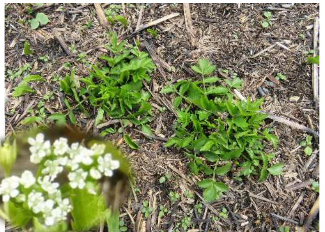
エキサイゼリ(準絶滅危惧)