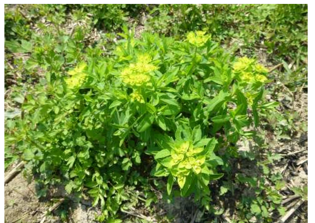
ノウルシ(準絶滅危惧)