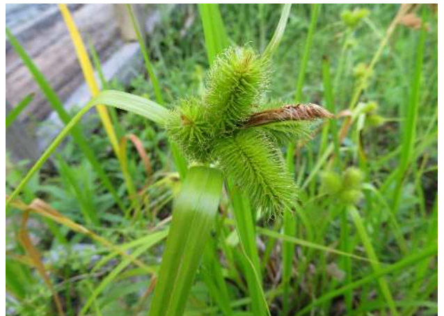
ジョウロウスゲ(絶滅危惧II類)湿地園