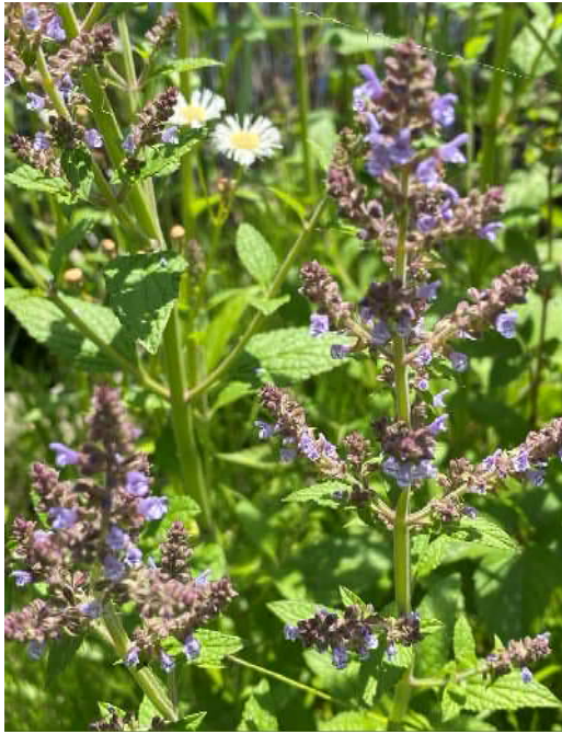
ミソコウジュ(準絶滅危惧)