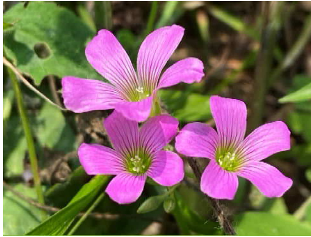
ムラサキカタバミ