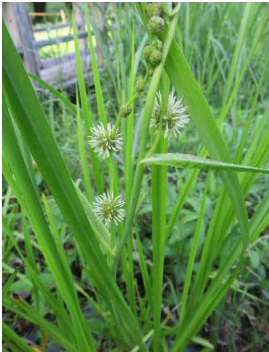
ミクリ(準絶滅危惧)湿地園