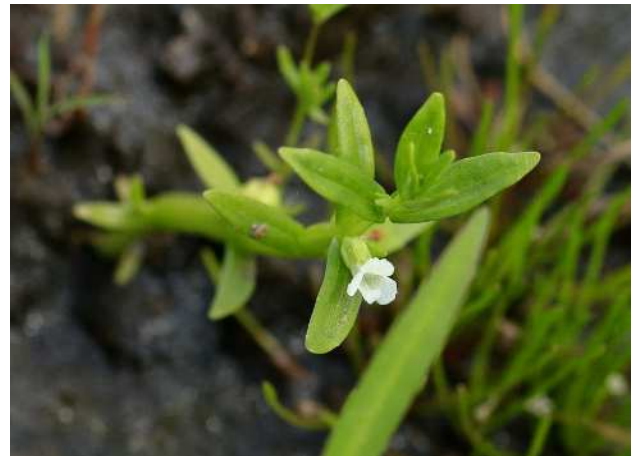
オオアブメ(絶滅危惧II類)