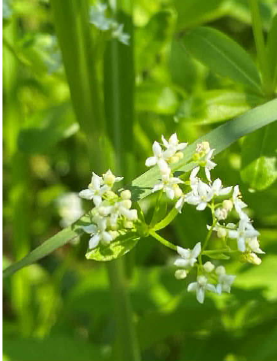
ハナムグラ(絶滅危惧II類)

梅雨入りの前に遊水地に出かけませんか？鳥たちの鳴き声に癒されます。 谷中湖周辺利用の際には、マスク着用等感染防止にご協力をお願いします。