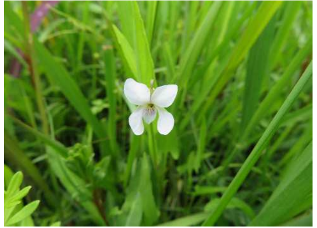
タクスミ(絶滅危惧II類)湿地園