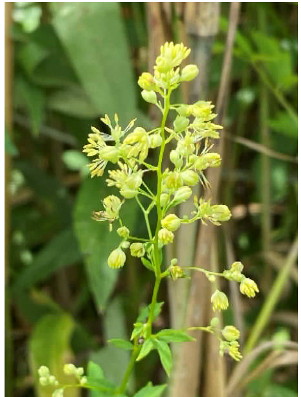
ノカラムツ(絶滅危惧Ⅱ類)