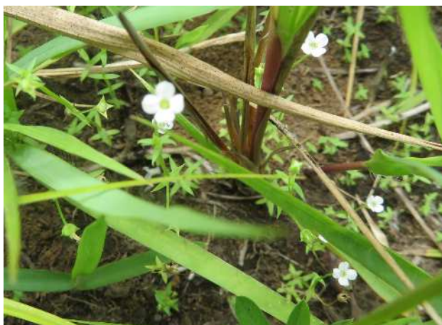
ヒメナエ(絶滅危惧Ⅱ類)