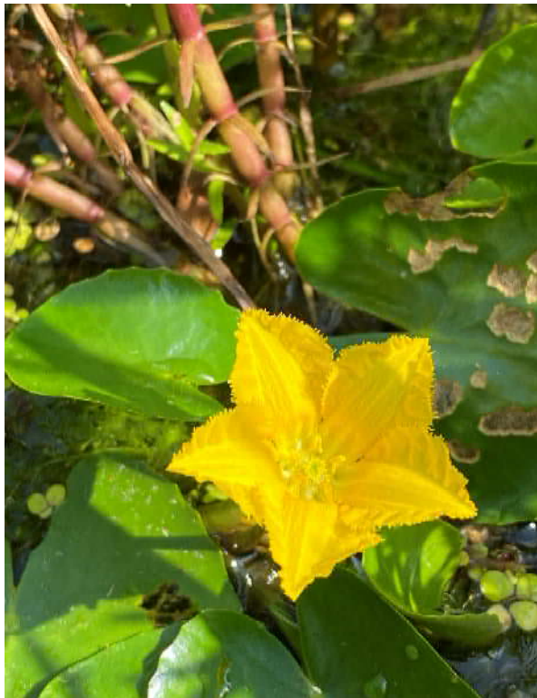
アサザ(準絶滅危惧)湿地園

親水多目的ゾーン内の多自然池がリニューアルオープンしました。 散策中には水分補給を忘れずに熱中症に気をつけましょう。