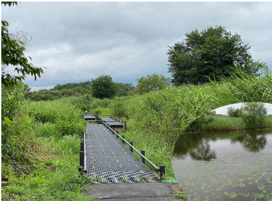
多自然池入口と池