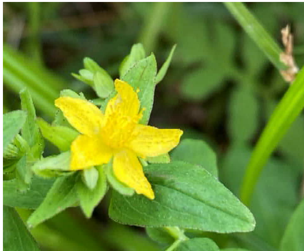
アゼオトギリ(絶滅危惧ⅠB類)