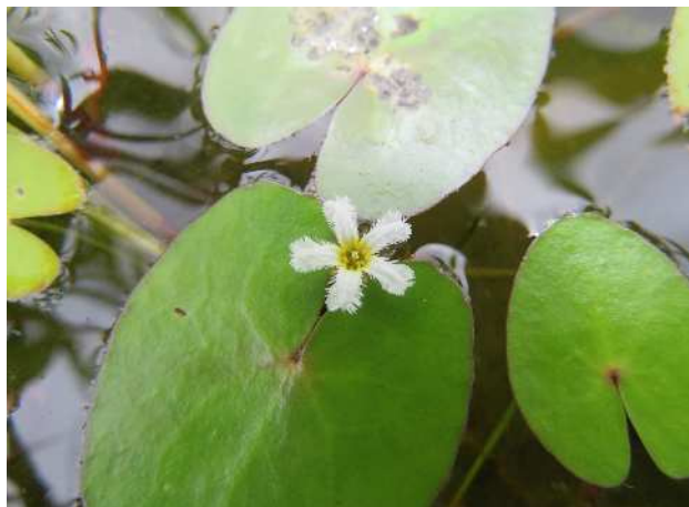
ヒメシロアサザ(絶滅危惧II類)湿地園