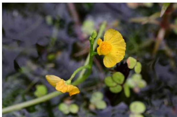
イヌタヌキモ(準絶滅危惧)湿地園