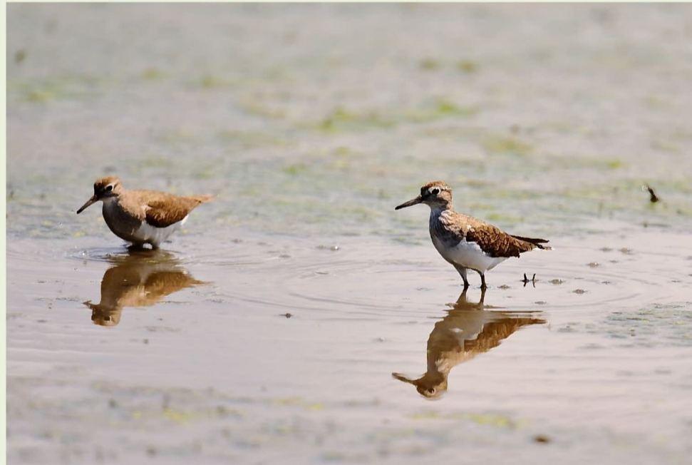
イソシギ(第2調節池)