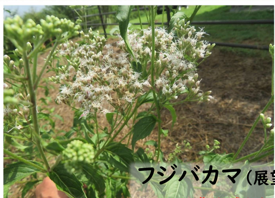
フジバカマ(展望台裏) 準絶滅危惧