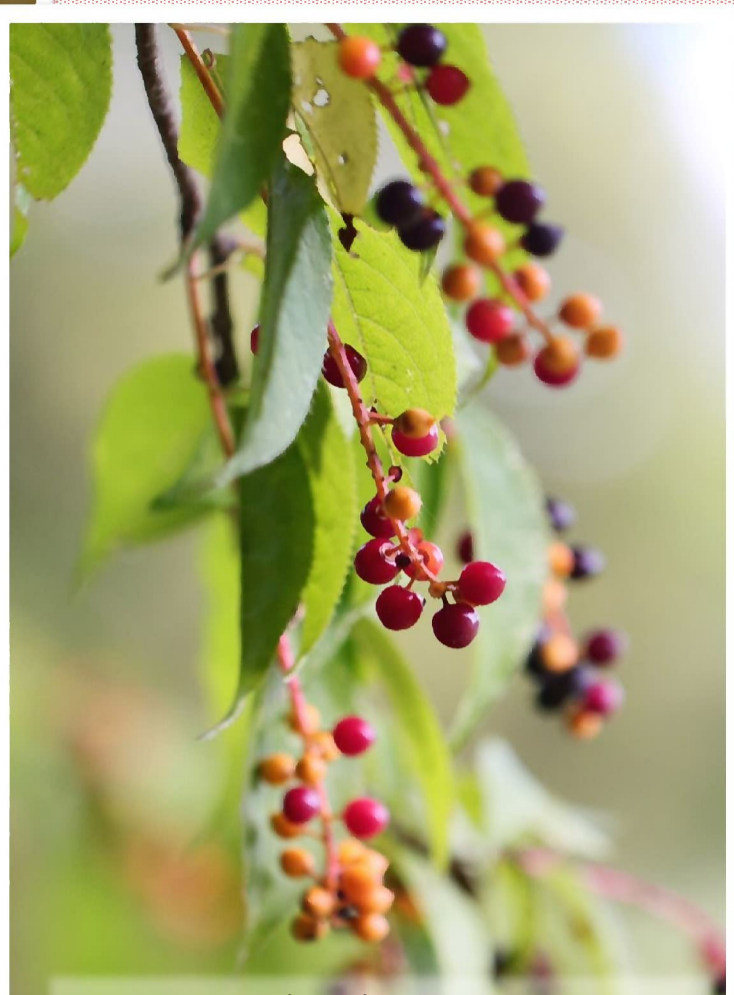
ウワミズザクラの果実 (親水広場エコトイレ前)