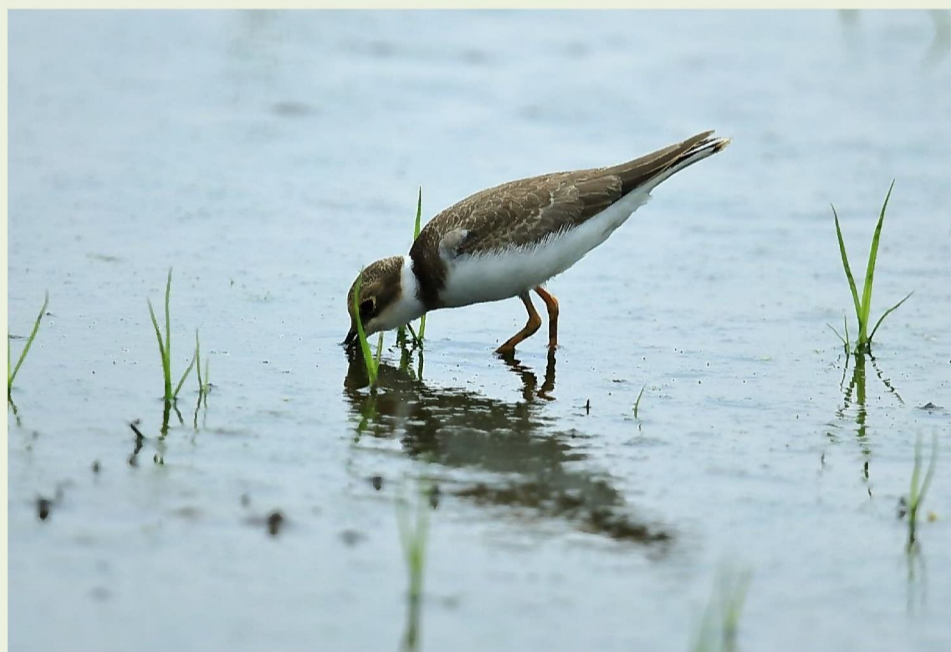
コチドリ(第2調節池)