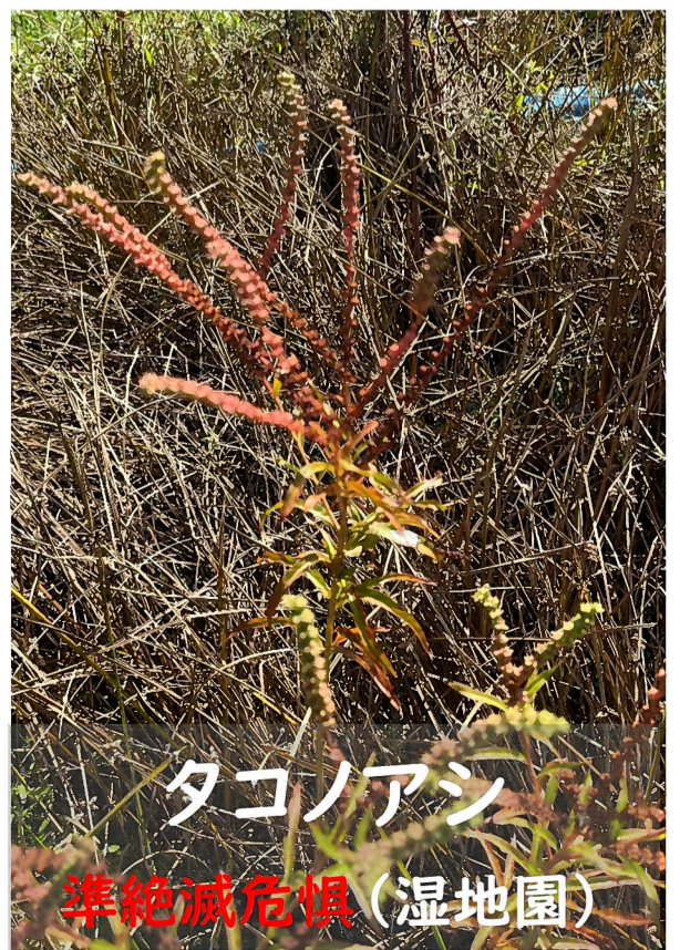
タコノアシ 準絶滅危惧 (湿地園)