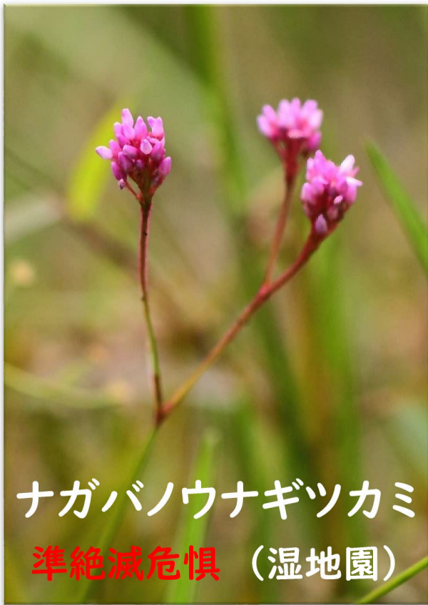
ナガバノウナギツカミ 準絶滅危惧 (湿地園)