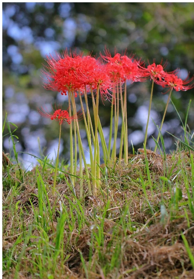
ヒガンバナ (旧谷中村役場跡)