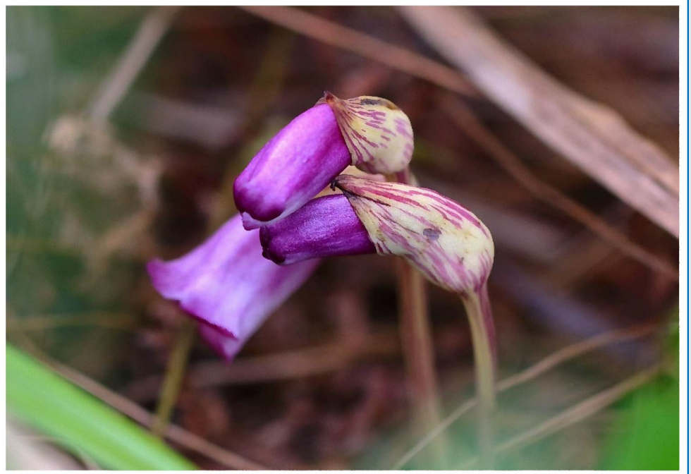
ナンバンギセル (藤岡渡良瀬運動公園)