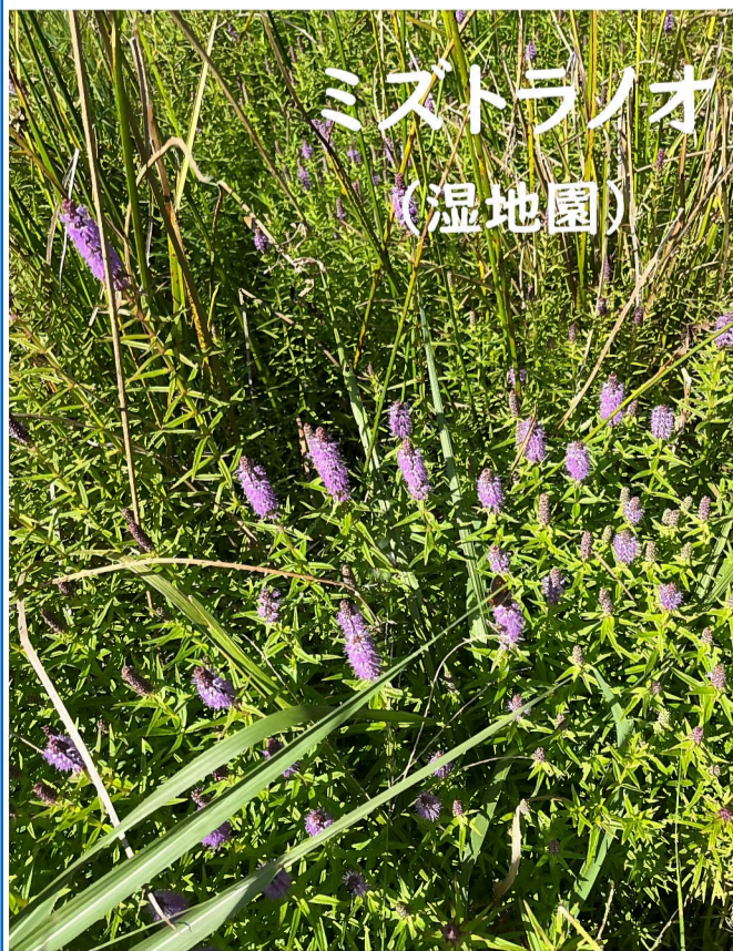
ミズトラノオ (湿地園)

膨らんだ実に触れると「パチっ」と勢いよく皮が丸まり、その勢いで中の種が飛ばされます。