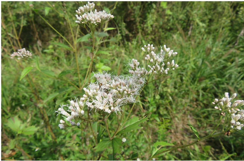
フジバカマ (史跡保全ゾーン) 準絶滅危惧