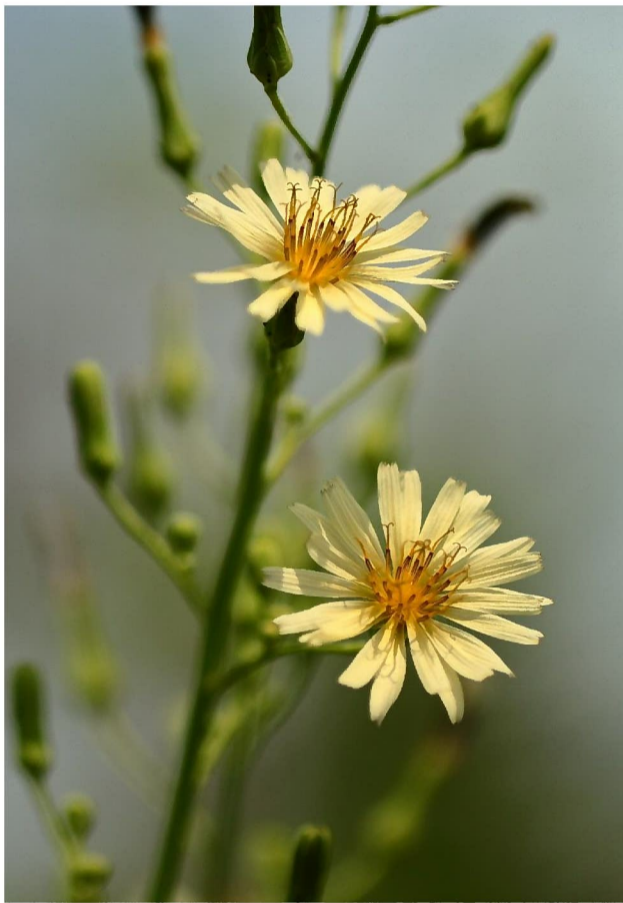
アキノノゲシ (谷中湖周辺)