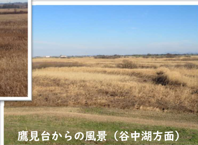
鷹見台からの風景 (谷中湖方面)