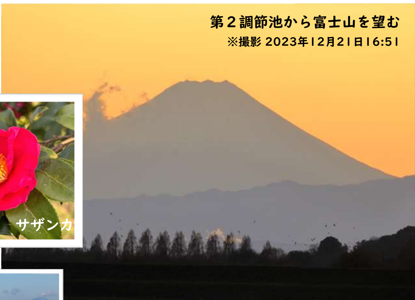
第2調節池から富士山を望む