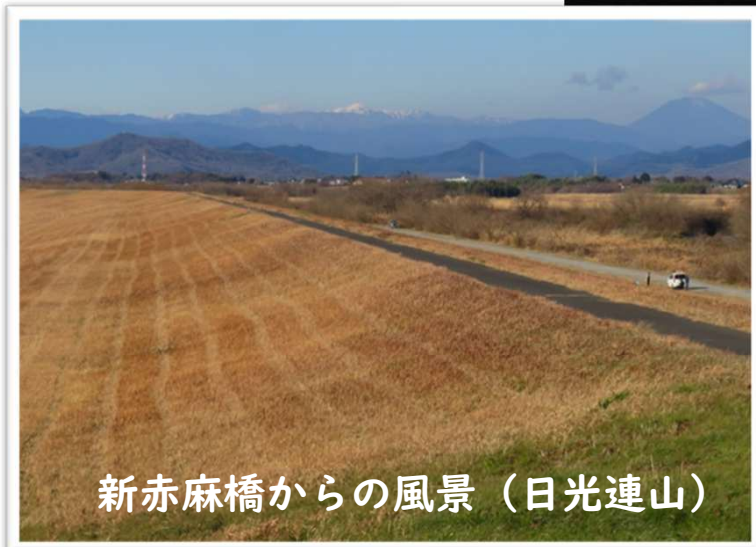
新赤麻橋からの風景 (日光連山)