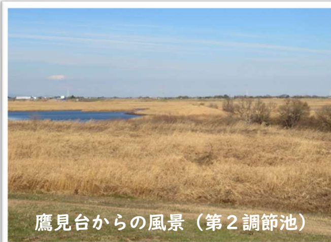
鷹見台からの風景 (第2調節池)