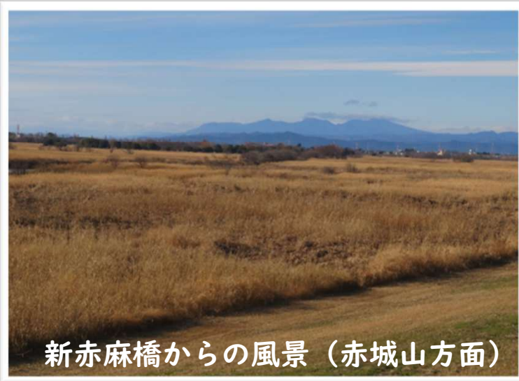
新赤麻橋からの風景 (赤城山方面)