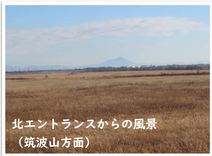
北エントランスからの風景 (筑波山方面)