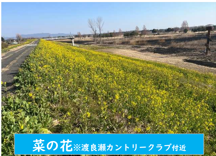
菜の花 ※渡良瀬カントリークラブ付近