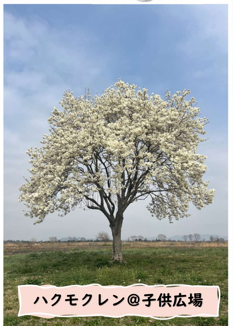
ハクモクレン@子供広場