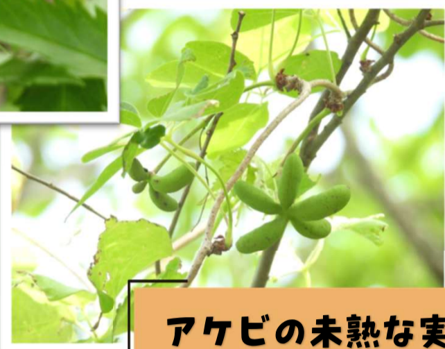
アケビの未熟な実