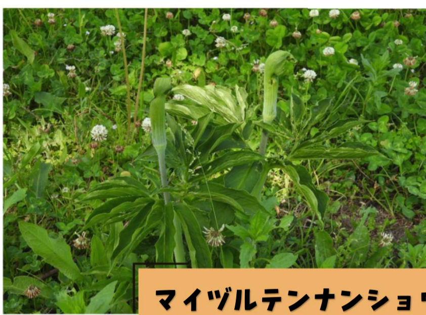
マイヅルテンナンショウ