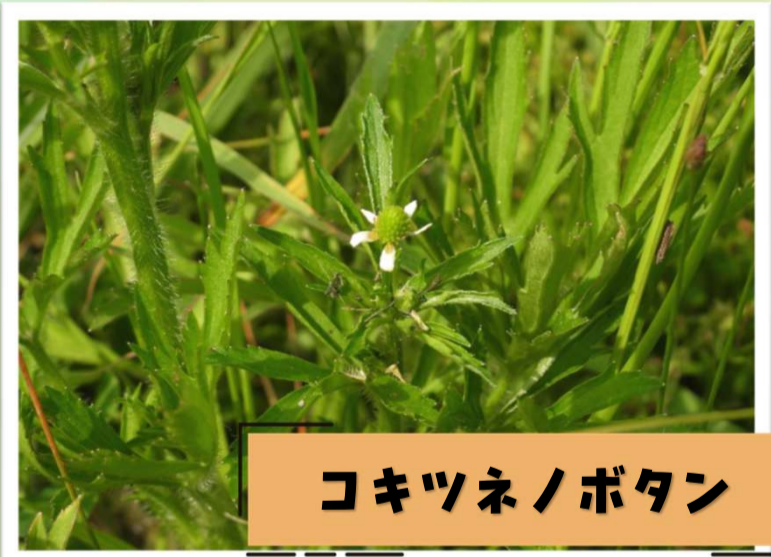
コキツネノボタン