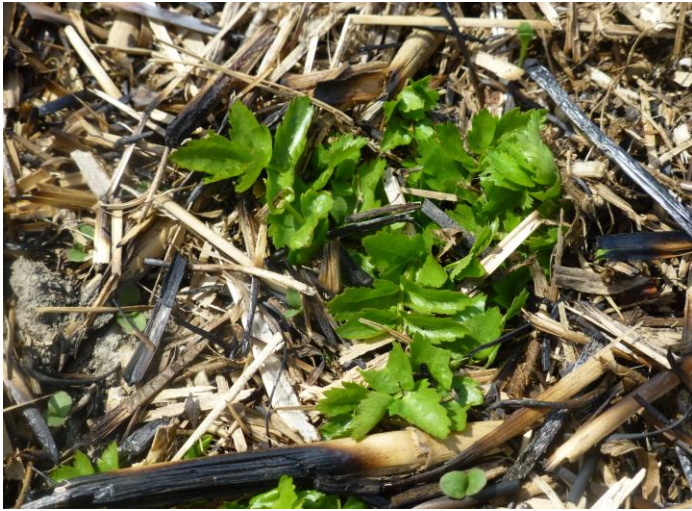
エキサイゼリ(準絶滅危惧)