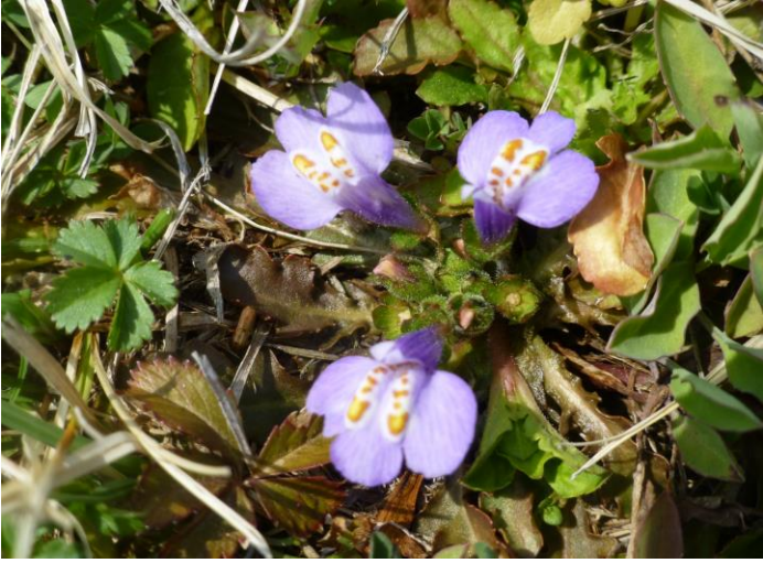
ムラサキサキゴケ