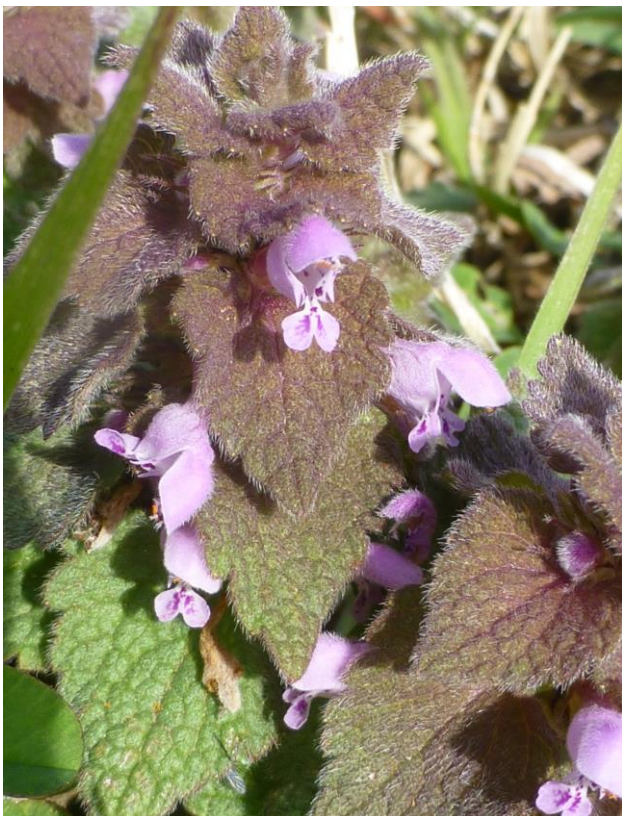
ヒメオドリコソウ