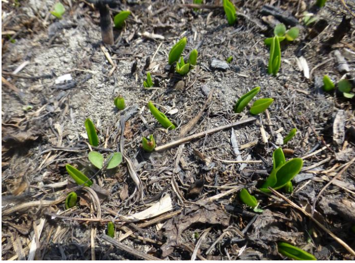
トネハナヤスリ(絶滅危惧)