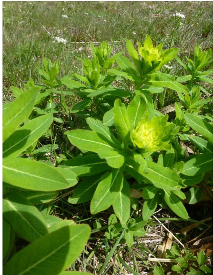
ノウルシ(準絶滅危惧)