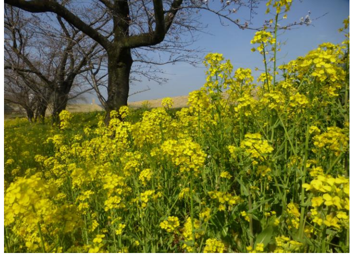
セイヨウアブラナ