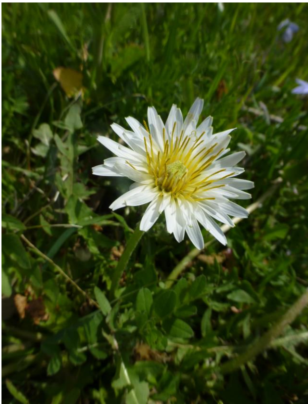
シロバナタンポポ