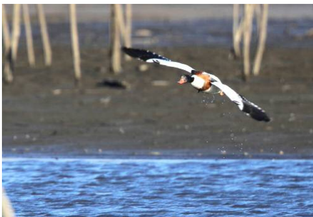
ツクシガモ (絶滅危惧IB類)