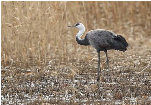
ナベヅル (絶滅危惧II類)

毎日寒い日が続き、野鳥観察のシーズンになりました。 乾燥していますので、火の取り扱いに十分注意し、マナーを守って観察しましょう。