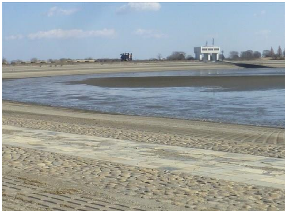
谷中湖の水質浄化のために、干し上げをしています