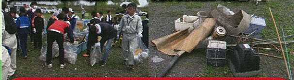
集められたゴミの山