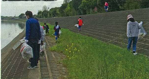
参加者によるゴミ拾い