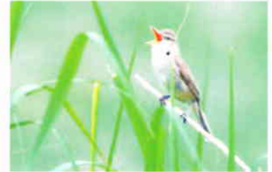
オオヨシキリなど草原の鳥に期待

日時 2017年5月14日(日) 9時～11時 集合 群馬県板倉町海老瀬 思い出橋駐車場 9時 東武日光線「板倉東洋大前駅」徒歩15分 観察地 栃木市 渡良瀬遊水地 持ち物 雨具、筆記用具、(あれば) 双眼鏡・図鑑 無料貸出 双眼鏡、図鑑 参加費 200円 (会員 100円、中学生以下 無料) 申込み 不要 雨天時 中止